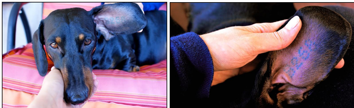
Rys. 2, 3. Umiejscowienie tatuażu identyfikującego na przykładzie psa