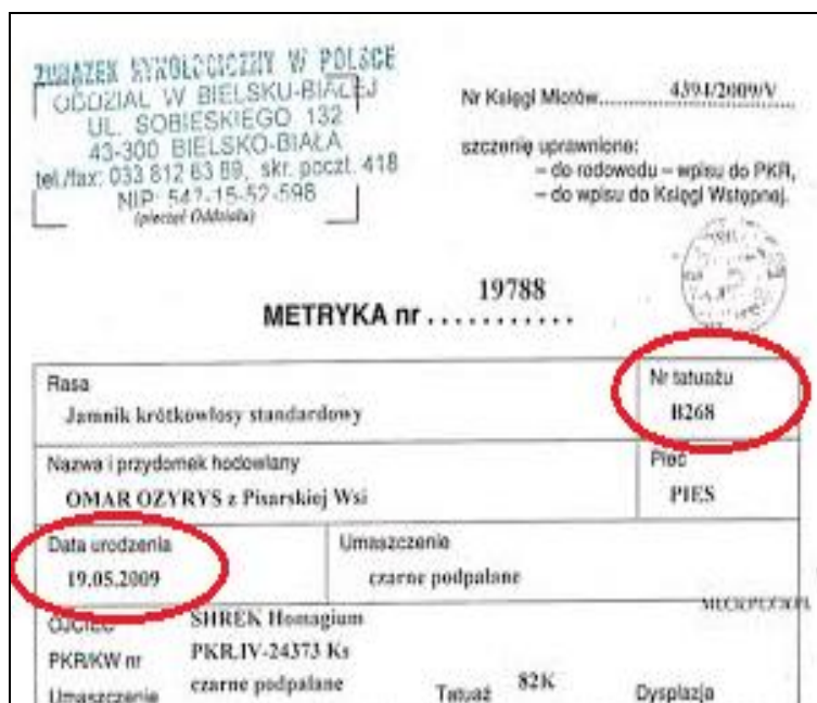
Rys. 4. Fragment metryki zwierzęcia ze zwróceniem uwagi na numer tatuażu Fig. 4. Fragment of animal's metric focused on tattoo number

Od 03.07.2011 r. jedyną akceptowalną formą identyfikacji zwierzęcia jest jego oznakowanie za pomocą transpondera [5].