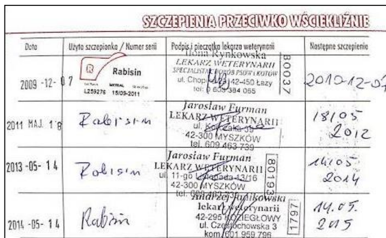
Rys. 7. Potwierdzenie szczepienia przeciwko wściekliźnie