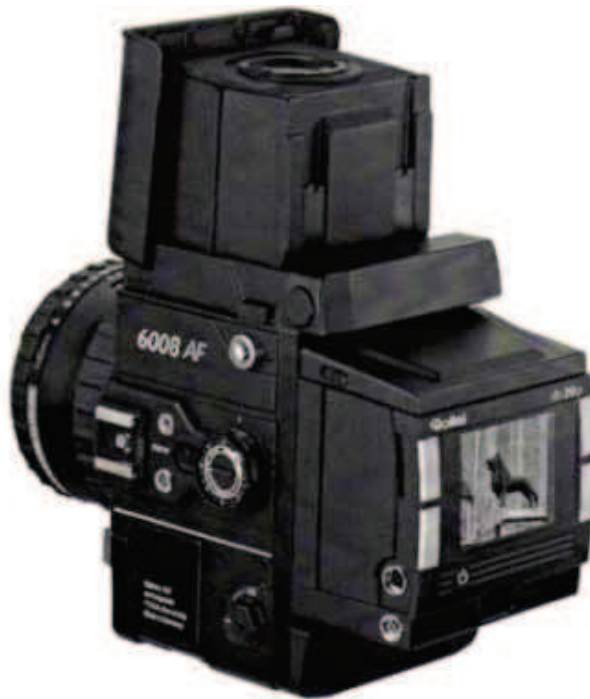
Rys.1. Kamera RolleiMetric 6008 AF z przystawką cyfrową

Kamera RolleiMetric 6008AF (rys.1) jest wyposażona w przystawkę cyfrową o wymiarach matrycy 36.684 \text{ mm} \times 36.72 \text{ mm} , liczbie pikseli 4076 \times 4080 (16.6 mln pikseli) i rozmiarze piksela 9 \text{ }\mu\text{m} . Przy długoogniskowym obiektywie ( f = 80\text{mm} ), stosując „ręczny” pomiar obrazu, z dokładnością 0.33 piksela, można osiągnąć rozdzielczość kątową rzędu 24'' . Zbliżono się zatem do poziomu dokładnościowego standardowego teodolitu klasy Theo 020 (wystarczającego często w przypadku pomiaru punktów niesygnalizowanych). Przy podpikselowej dokładności pomiaru rzędu 0.1 piksela można osiągnąć dokładność precyzyjnego teodolitu klasy Theo 010. Odbywa się to jednak kosztem ograniczonego zasięgu kąowego kamery (tylko 25^\circ ). W sytuacji, gdy możliwy jest dokładny pomiar wysmukłej budowli tylko z niewielkiej odległości, mały zasięg pionowy zmusza do fotografowania i opracowywania wysokiego obiektu częściami. Dlatego przystosowano kamerę do rejestracji zdjęć poziomych i zdjęć nachylonych pod kątem 23^\circ , co daje sensowny zasięg pionowy do 35.5^\circ , przy dwustopniowej „zakładce” obydwu zdjęć. Dla porównania, zasięg górny kamery Photheo 19/1318 to niecałe 26^\circ . W konstrukcji zastosowano libelle o przewodzie 30'' . Autorami proponowanego rozwiązania są: Jerzy Bernasik i Marek Palusiński (projekt rozwiązania mechanicznego). Ostateczną postać nowego fototeodolitu cyfrowego przedstawiają rysunki 2 i 3.