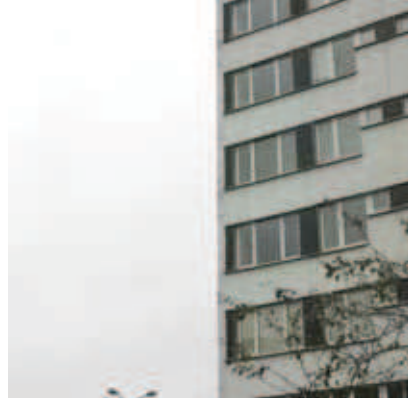
Rys. 4. Zdjęcie nachylone pola testowego

nachylonego; jego funkcję przejął punkt wspólny krawędzi budynku widoczny na obydwu zdjęciach. Jedno ze zdjęć pola testowego ukazuje rysunek 4.