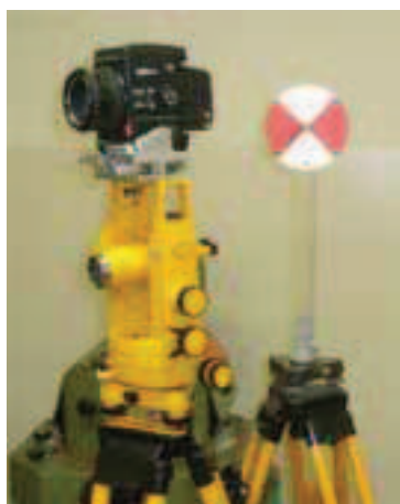
Rys. 3a. Fototeodolit w ustawieniu do zdjęcia poziomego