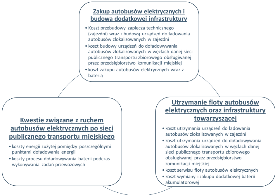
Rys. 3. Aspekty techniczno-ekonomiczne wdrożenia autobusów elektrycznych w przedsiębiorstwie komunikacji miejskiej

Chcąc wdrożyć autobusy elektryczne do eksploatacji, należy uwzględnić wszystkie ww. aspekty, co w ujęciu formalnym można zapisać następująco (4):